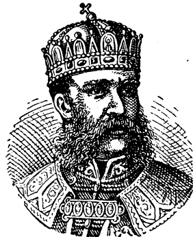
František Josef I.