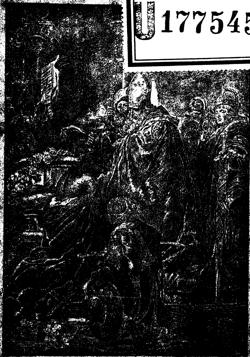
Krst svätého Štefana.